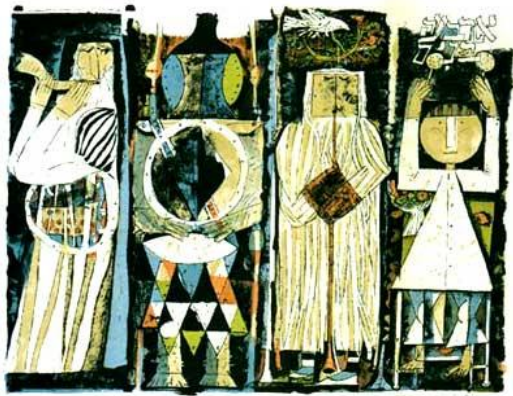
Four Children, Four Musicians: Shraga Weil (Israel, 1963; © Safrai Gallery)

ארבעת הבנים מוצגים כרביעיית נגנים, כל אחד בכלי משלו: החכם, עם שופר (אולי מכריז על ביאת המשיח כפי שאלהו מתואר בהגדות מימי הביניים); הרשע, עם תוף (אופייני לחיילים צועדים למלחמה); התם, עם קרן יער; זה שאינו יודע לשאול, עם רעשנים (אופייני לילד). הרביעייה נוצרת מצורות גיאומטריות בסיסיות: חכם ורשע - עיגולים; תם - מרובע; שאינו יודע לשאול - משולש ומעגל. הדמות הנבונה מתוארת כחכם מזוקן העונד טלית מפוספסת. הרשע הוא מכונה צבאית עשויה ממתכת שהשריון הוא גופו (ראש בקסדה עם עיניים, רגליים כצינורות). התם מזוהה עם נח שנקרא "תמים" כלומר צדיק גמור. מעל ראשו נמצאת היונה עם ענף זית. גלימת הפסים שלו עשויה להזכיר את מעילו של יוסף. הדמות הרביעית (אולי ילדה?) נמוכת קומה ויחפה.